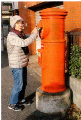
日本一の丸ポスト(小平市) 小平駅南口 ルネこだいら