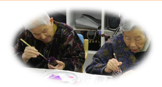
今月も 様々な イベントやレクレーションで おおいに 盛り上がりました!! ミニツリー作り・・リース作り・・ みなさんで作った・・ケーキなどで ちょっとした