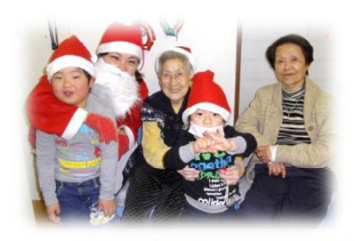
その他では もちろん 体操や運動系のゲーム・・・ 暖かい日には外に出て 散歩を楽しんで来ました